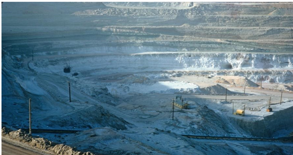
Borax-Bergbau in Boron, Kalifornien

Selbst die niedrig dosierten und weniger effektiven Bor-Tabletten werden von der Pharma-Industrie streng überwacht. Ihr Verkauf kann durch Vorschriften im Codex Alimentarius jederzeit eingeschränkt werden. Damit hat die Pharmaindustrie alle von Borax ausgehenden Gefahren unter Kontrolle gebracht und ihre Profite und ihr Überleben gesichert